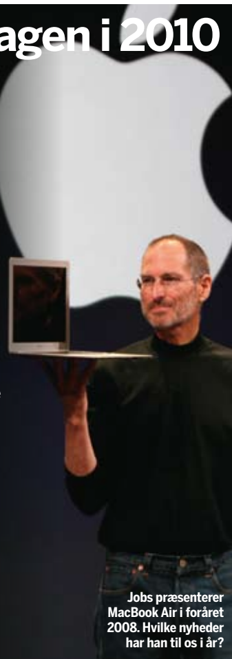
Jobs præsenterer MacBook Air i foråret 2008. Hvilke nyheder har han til os i år?

Følger Apple de seneste års trend, bliver der til september holdt en "special event", hvor der præsenteres en ny kollektion iPods. Mon ikke iPod Touch endelig får kamera?