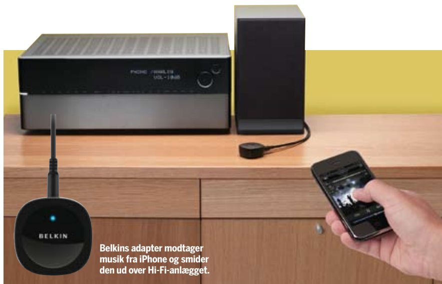
Belkins adapter modtager musik fra iPhone og smider den ud over Hi-Fi-anlægget.